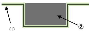
図-1 断面修復工の工程